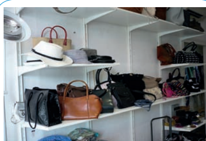
Elle vend aussi des accessoires de mode : sacs à main, chapeaux, ceintures, foulards...