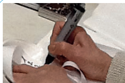
Elle donne un numéro à la cliente et l'écrit sur un sac dans lequel elle range les vêtements déposés.