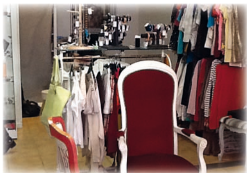
Dans sa boutique, Carole vend des vêtements d'occasion.