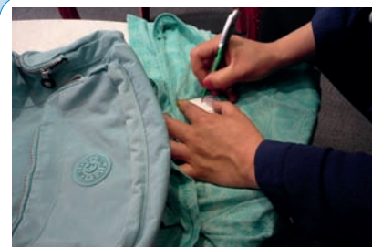
Carole prépare l'étiquetage du vêtement.