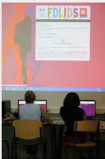
Présentation de l'application au collège Olympe Ramée de Corbin à Saint-Anne