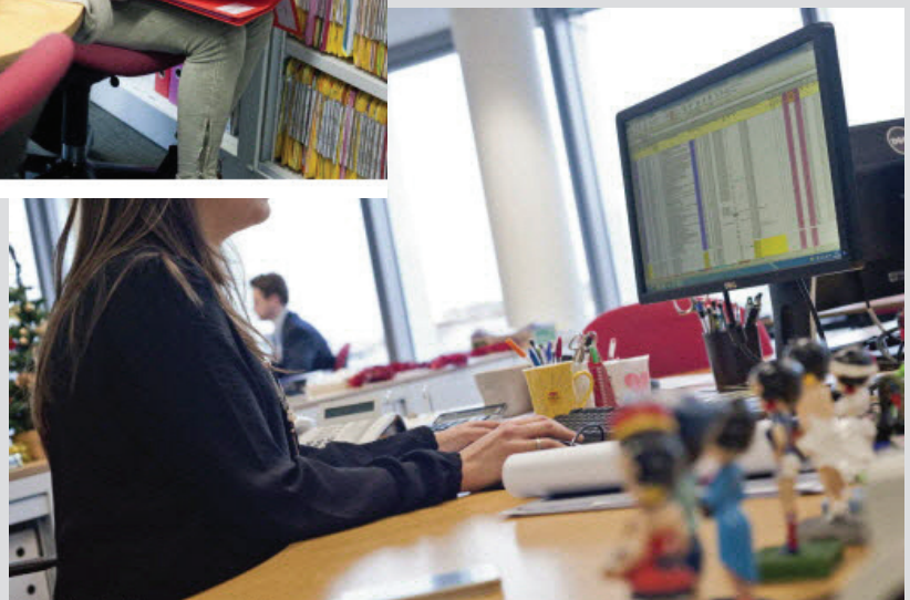
© - Grégoire Maisonneuve / Onisep