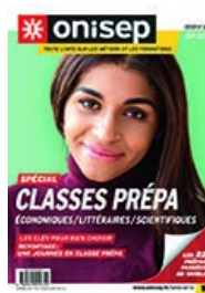
Dossiers : Classes prépa