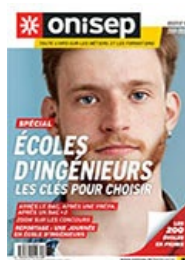
Dossiers : Ecoles d'ingénieurs