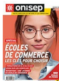
Dossiers : Ecoles de commerce