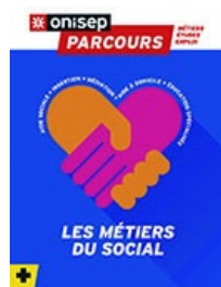
Parcours : Les métiers du social