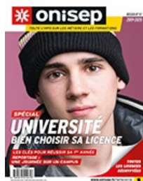
Dossiers : Université bien choisir sa licence